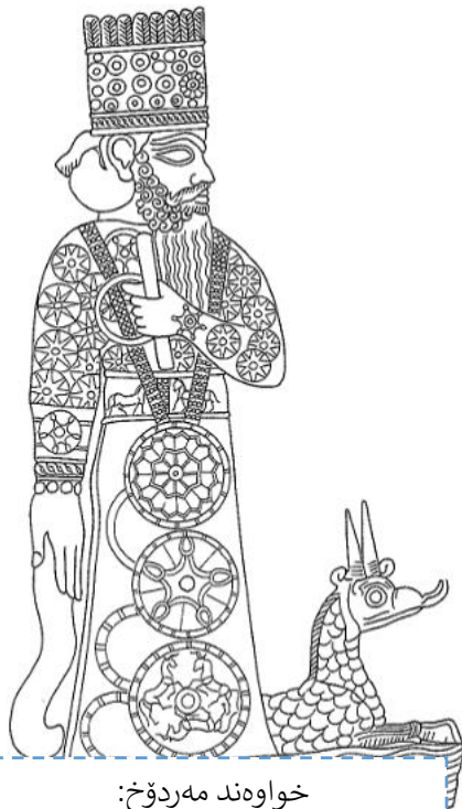
خواوهند مهردۆخ: (Black & Green, ۱۹۹۲: ۱۲۹).

خوداوهند مهردۆخ ناوه که ی له دهقه سۆمه ریه کاندایه ناوی (AMAR d ) (UTU بهواتای "خیرای خوداوهند شمش" و له زمانێ ته که دیدا به ناوی "مهردوک - Marduk" هاتوه، ناوی ئامار-ئوتو که باوترین رینوسی ناوی ئاسمانی مهردۆخه، ئاماژهیه بۆ په یوهندی نێوان مهردۆخ و خوداوهندی شمش، سه رهتای باسکردنی خوداوهندی مهردۆخ ده گه رپته وه بۆ سالی ۲۶۰۰ پ.ز، له کاتیکدا کۆنترین وه سفی ئه ده بی بۆ خوداوهند مهردۆخ له پیشه کی یاسای حه مورا بیدا (۱۷۹۲ - ۱۷۵۰ پ.ز) ده رده که ویت، (الکریمای، ۲۰۱۶: ۳۱-۳۵).